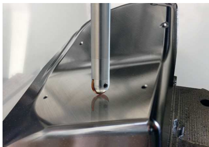
Gesenk- und Formenbau Mold and Die